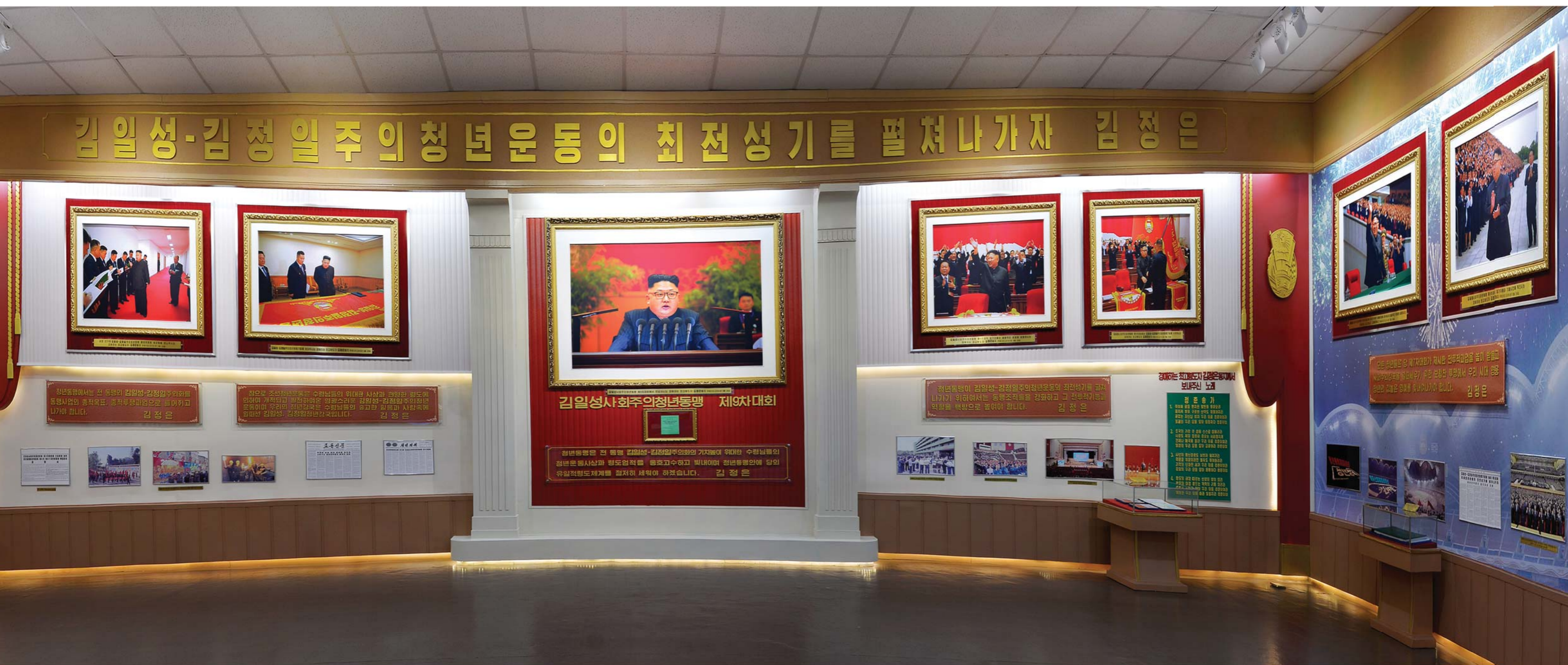
김일성사회주의청년동맹 제9차대회가 진행된 자료들