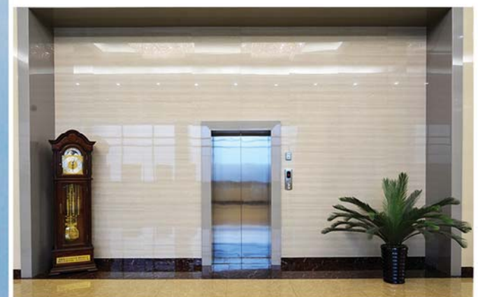
승강기 电梯 Lift