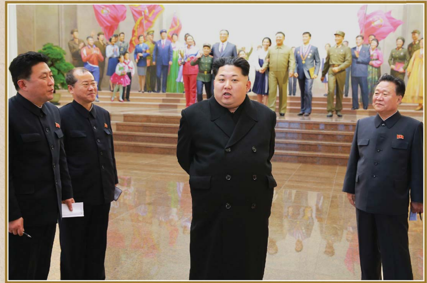
청년운동사적관 총서홀을 돌아보시는 경애하는 최고령도자 김정은 동지 주체105(2016)년 1월 敬爱的最高领导者金正恩同志察看青年运动史迹馆总序大厅。2016年1月 Kim Jong Un looking round the general review hall of the museum in January 2016

The Youth Movement Museum gives a clear glimpse of the path the Korean youth movement has travelled so far and its promising future.