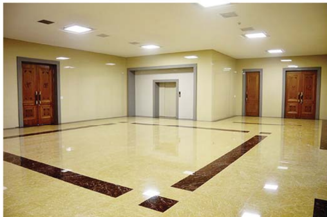
2층홀 二楼大厅 Foyer on the second floor