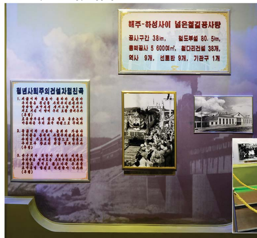
전후복구건설을 위한 청년들의 투쟁자료들

Materials about the wise leadership of Kim Il Sung and Kim Jong Il in establishing a monolithic ideological system among young people and students