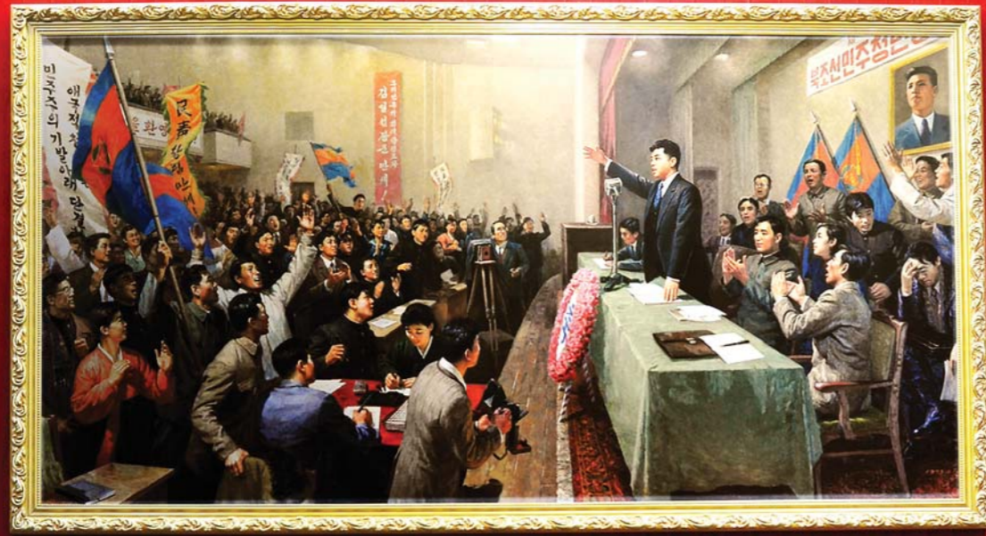
북조선민주청년동맹창립을 선포하는 위대한 수령 김일성동지 주체35(1946)년 1월 17일