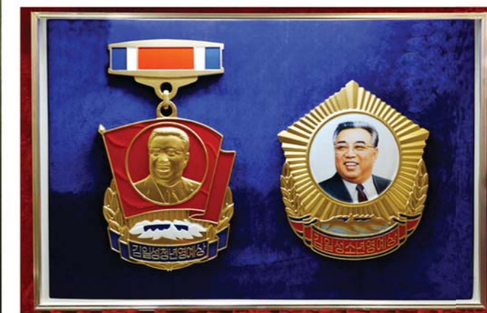
새로 제정된 김일성청년영예상과 김일성소년영예상 주체61(1972)년 1월

Materials showing that Kim Il Sung wisely led the work to train the young people and students as capable personnel who are knowledgeable, morally sound and physically strong