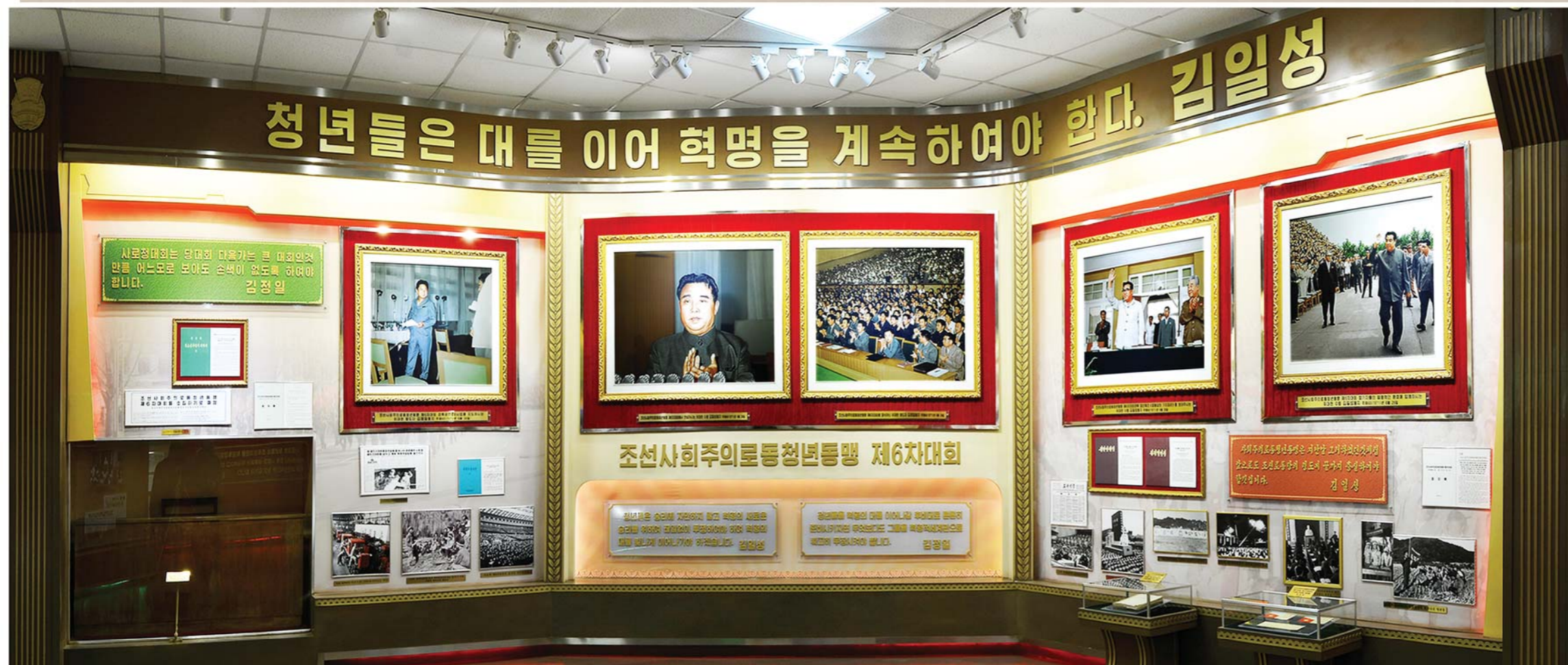
조선사회주의로동청년동맹 제6차대회가 진행된 자료를 召开朝鲜社会主义劳动青年同盟第六次大会的资料

Materials about the Sixth Congress of the League of Socialist Working Youth of Korea