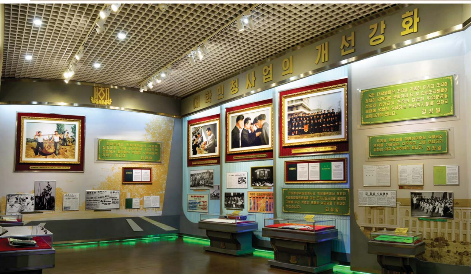
대학민청사업을 개선강화하기 위하여 청년들이 벌린 활동자료들 图为青年们为改进和加强大学民青工作的活动资料

Materials about the activities of young people to improve the work of the university committee of the DYL