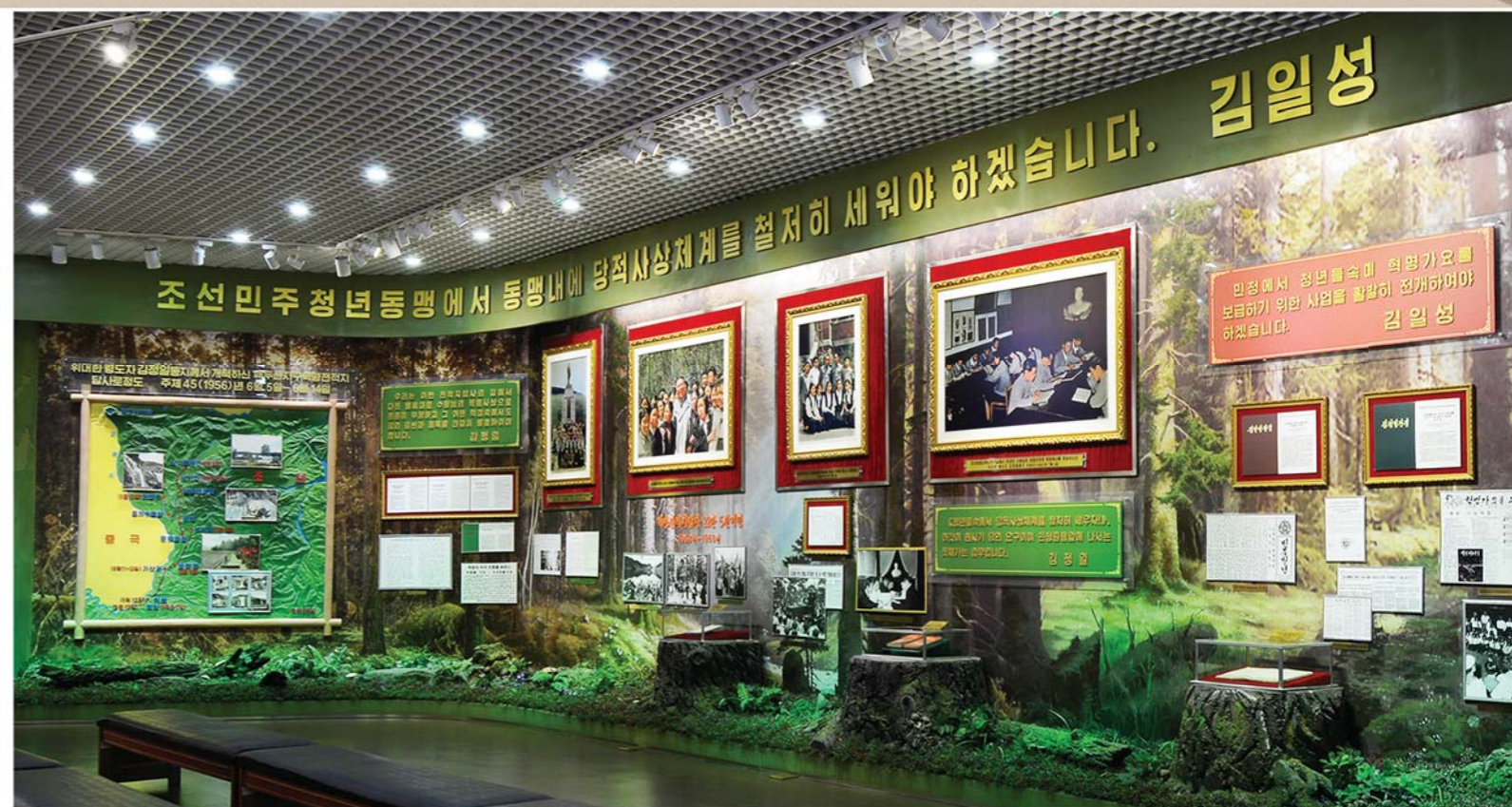
위대한 수령 김일성동지와 위대한 령도자 김정일동지께서 청소년학생들속에서 유일사상체계를 세우기 위한 사업을 현명하게 조직령도하신 자료들

Model of a clubhouse of the DYL built in the postwar days