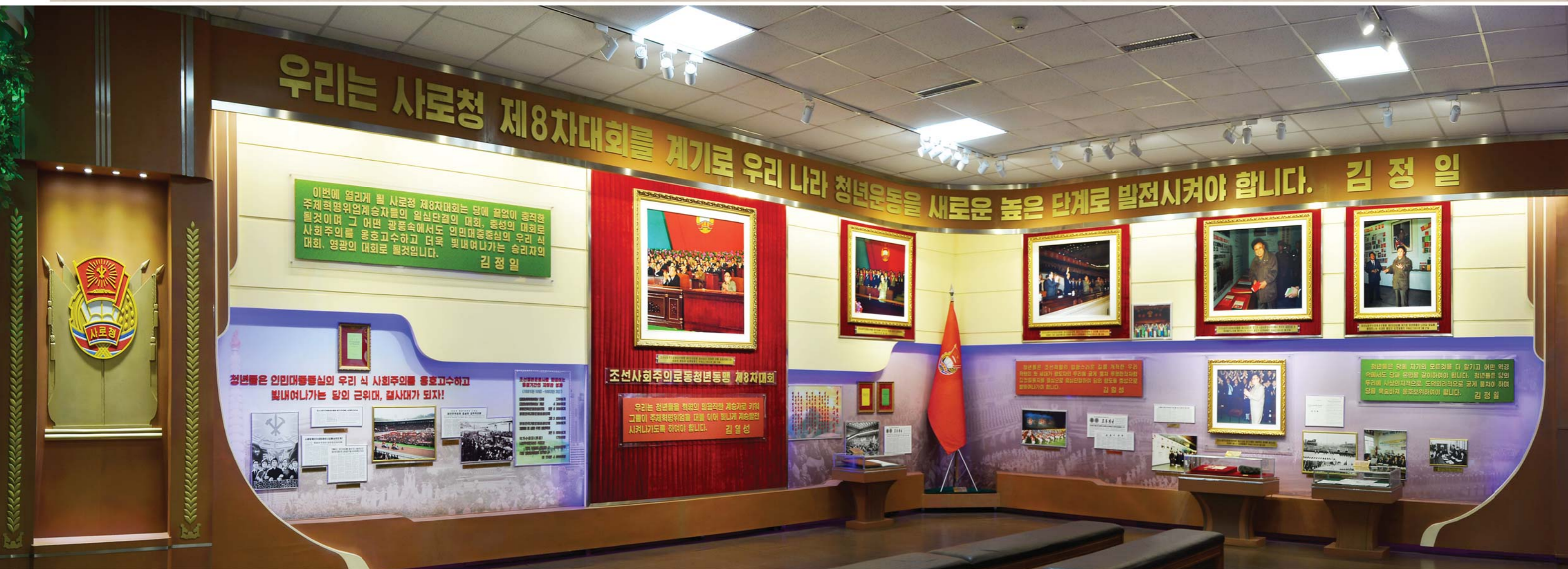
조선사회주의로동청년동맹 제8차대회가 진행된 자료들 召开朝鲜社会主义劳动青年同盟第八次大会的资料

Materials about the Eighth Congress of the League of Socialist Working Youth of Korea