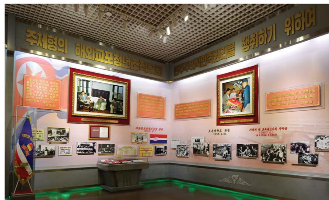
해외교포청년조직-재일본조선청년동맹이 벌린 투쟁자료들 海外侨胞青年组织——旅日朝鲜青年同盟的活动资料

Materials about the struggle of the Korean Youth League in Japan, an overseas Korean youth organization