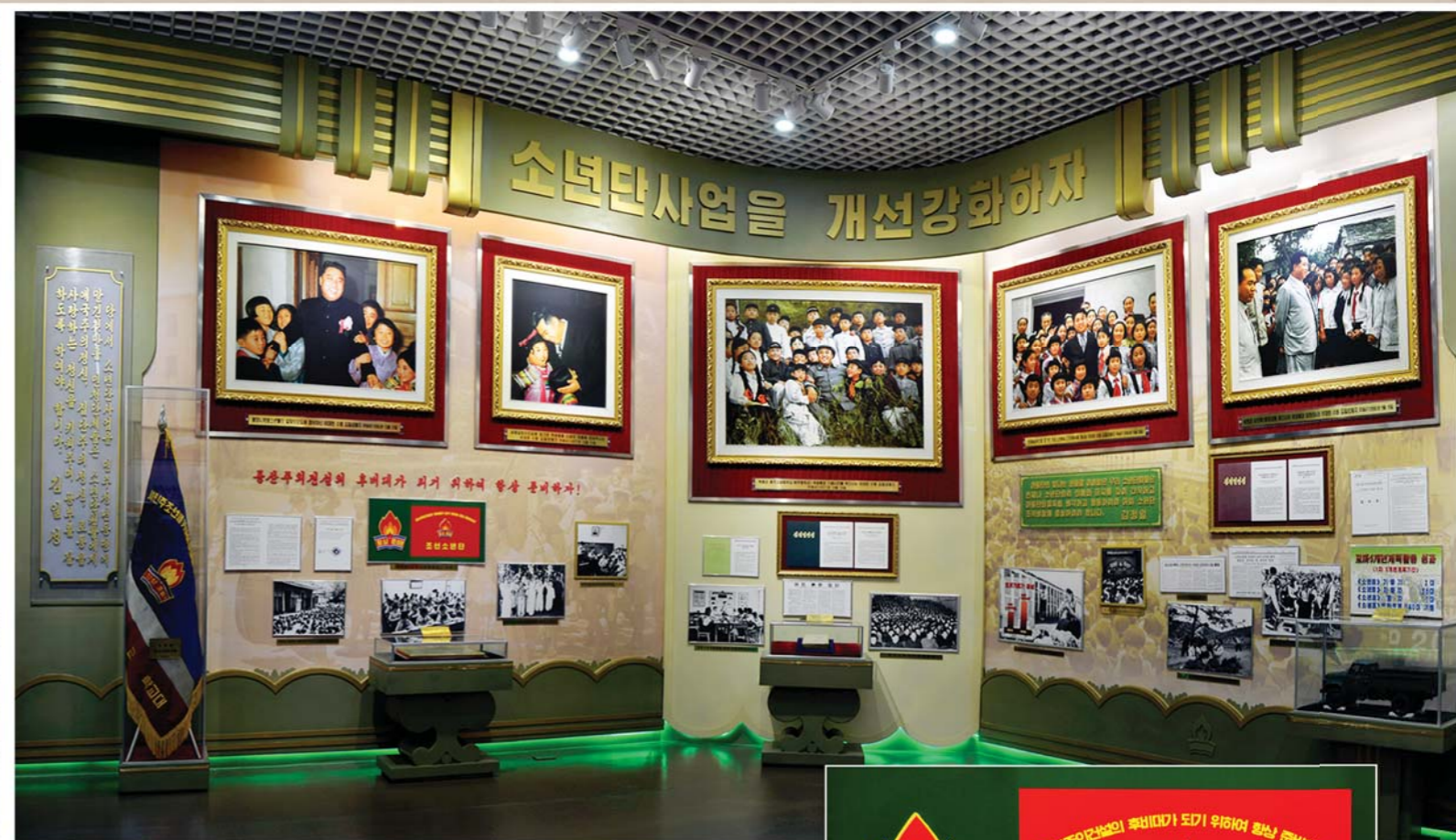
현실발전의 요구에 맞게 소년단사업이 개선강화된 자료들 少年团工作根据现实发展的要求得到改进和加强的资料

Materials about the development of the work of the Korean Children's Union as required by the developing reality