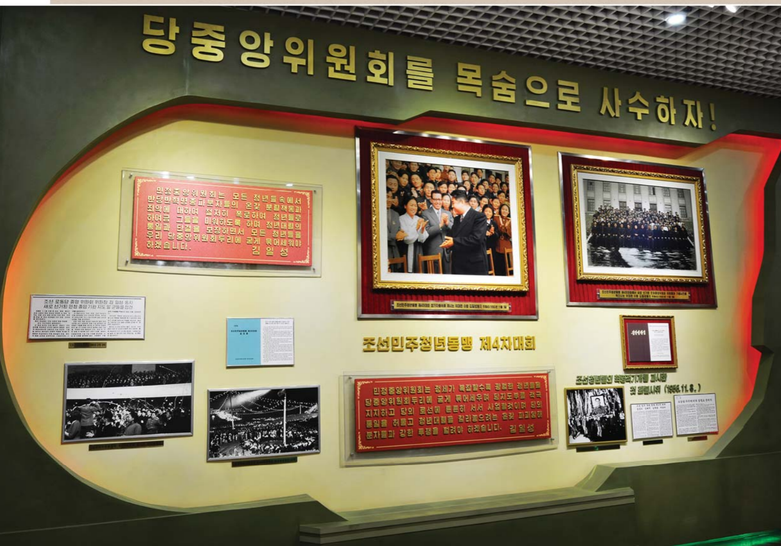
전후 청년동맹이 강화발전된 자료들