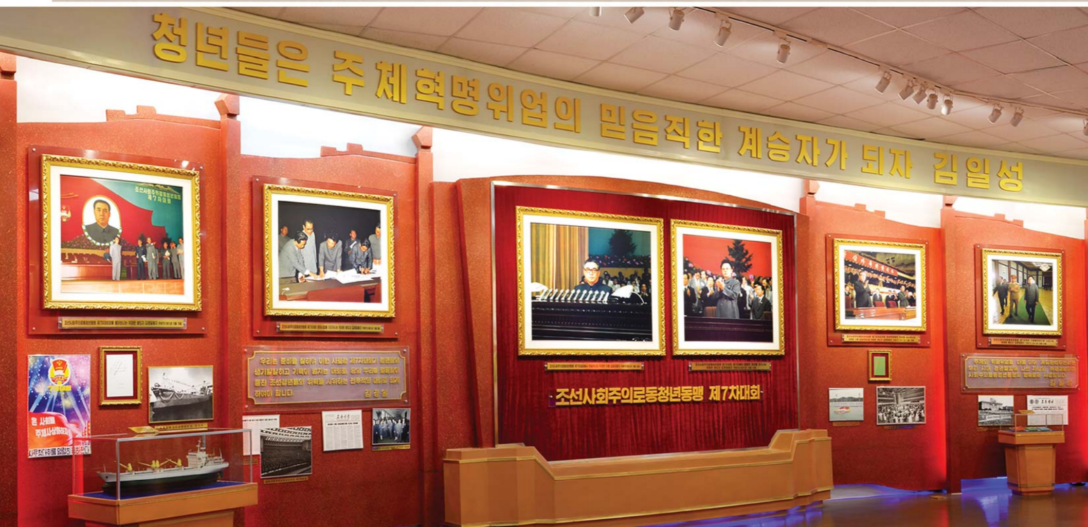
조선사회주의로동청년동맹 제7차대회가 진행된 자료를