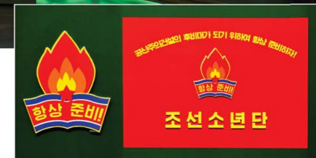
새로 개정된 조선소년단 휘장과 기발 주체47(1958)년 12월

Materials about the development of the work of the Korean Children's Union as required by the developing reality