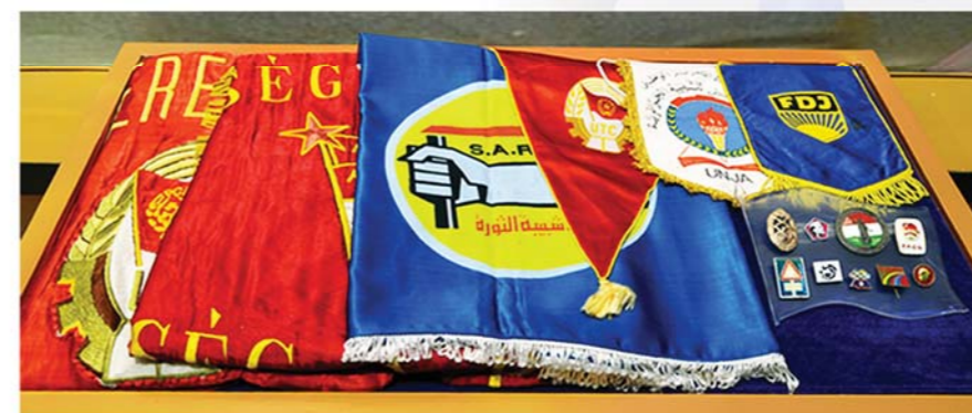
축전기념회장과 세계 각국 청년조직대표들에게서 받은 회장과 축기 联欢节纪念徽章、世界各国青年组织代表赠送的徽章和锦旗

Commemorative badge of the festival, and badges and congratulatory banners from the delegates of youth organizations of the world