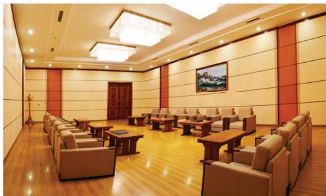
상봉 및 방문록실 会客及留言室 Room for meeting and visitors' book