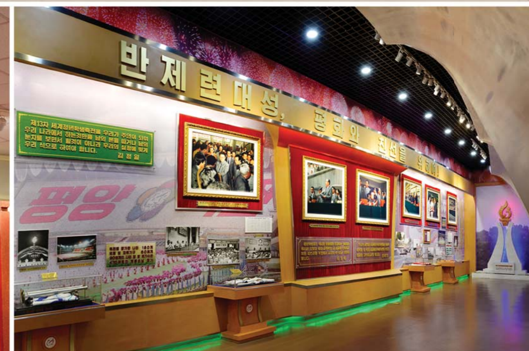
평양에서 제13차 세계청년학생축전이 성황리에 진행되는데 대한 자료를 在平壤盛况空前地举行第十三届世界青年与学生联欢节的资料

Materials about the 13th World Festival of Youth and Students held splendidly in Pyongyang