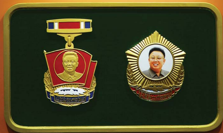
새로 제정된 김정일청년영예상과 김정일소년영예상 주제 101(2012)년 2월