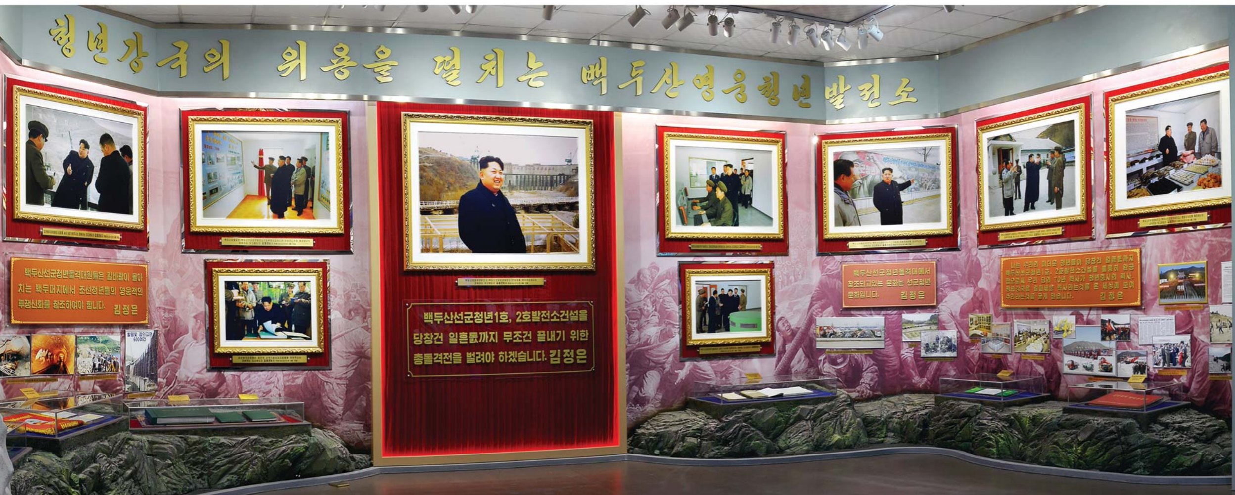
백두산영웅청년돌격대원들의 투쟁을 보여주는 자료들