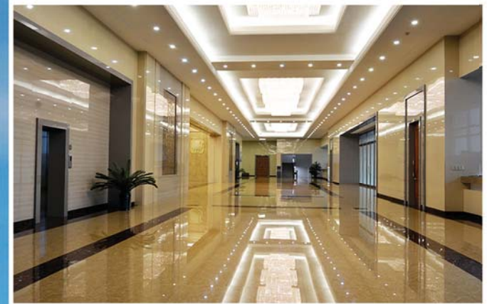
중앙홀 中央大厅 Entrance hall