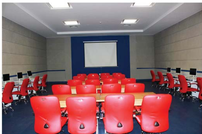
컴퓨터열람실 电脑阅览室 E-reading room