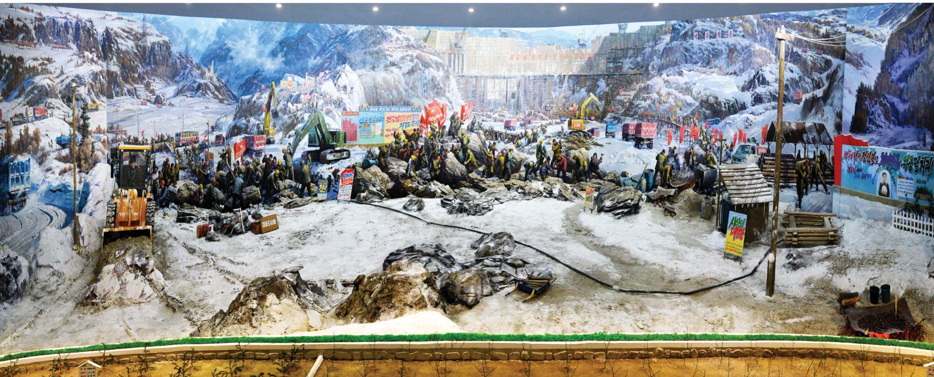
백두산영웅청년발전소 건설과정을 형상한 대형반경화