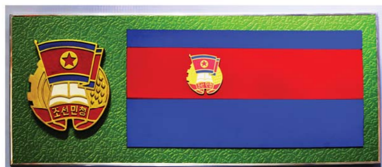
새로 개정된 조선민주청년동맹 휘장과 기발 주체 43(1954)년 6월

Materials about the development of the youth league after the war