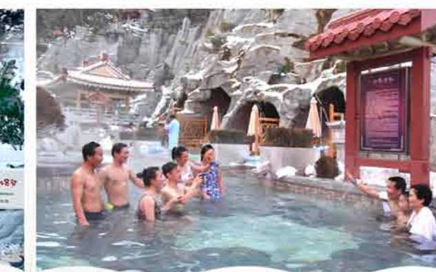
Sokthang Hot Spring Ванна «Соктхан».