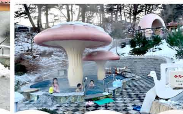
Spa bath for children Ванна для детей.