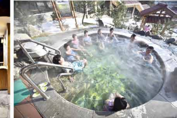
Thuja leaf spa bath Ванна с листьями биоты.

Под открытым небом — десятки ванн, к примеру, в виде каскада и дачи, для обслуживания семьи, детей и VIP-клиента, с листьями гинкго, а также парильня с лечебными камнями «Кымган» и др.