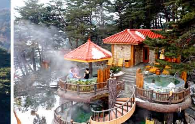
Terraced spa bath Ванна в виде каскада.