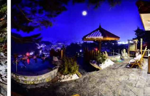
Ginkgo leaf spa bath Ванна с листьями гинкго.