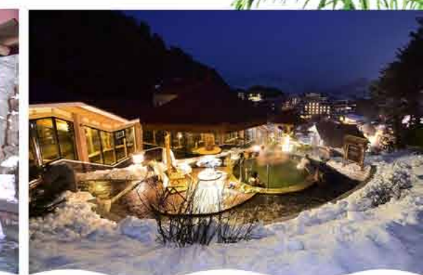
Angelica spa bath Ванна с дудником.