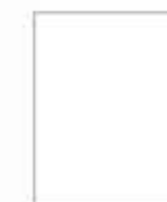
Some of gymnasiums on Chongchun Street Спортивные сооружения на улице Чхончхун.