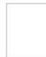
Monument to Party Founding Монумент основания ТПК.