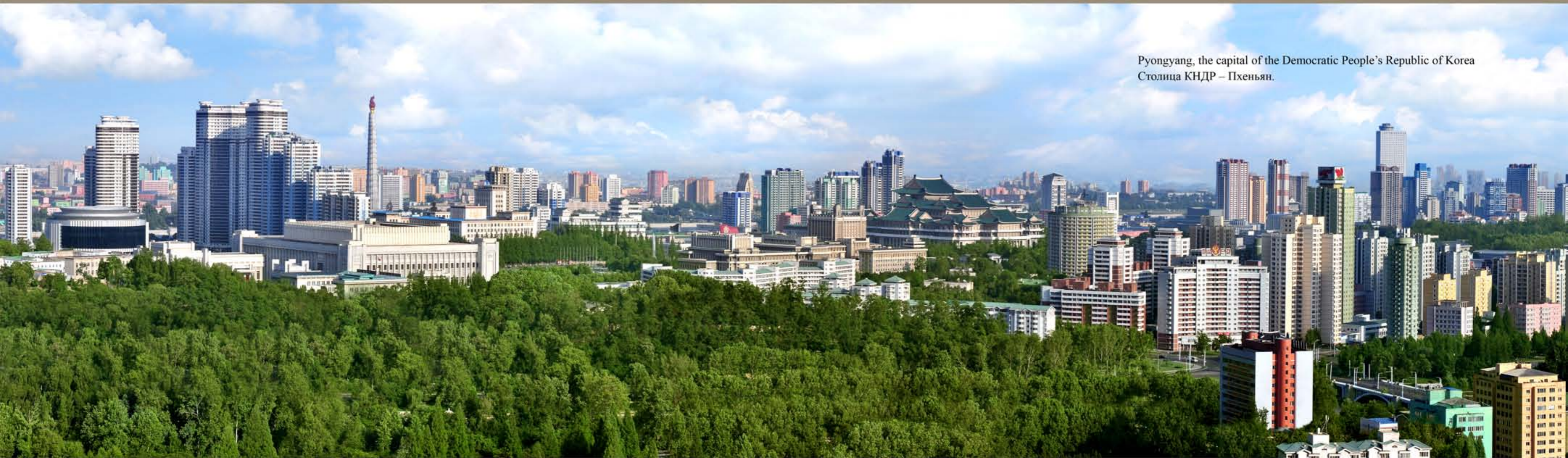
Pyongyang, the capital of the Democratic People's Republic of Korea Столица КНДР – Пхеньян.