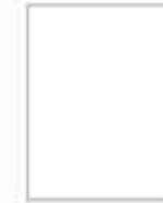
Grand Monument on Mansu Hill Мансудэский мемориальный скульптурный комплекс.