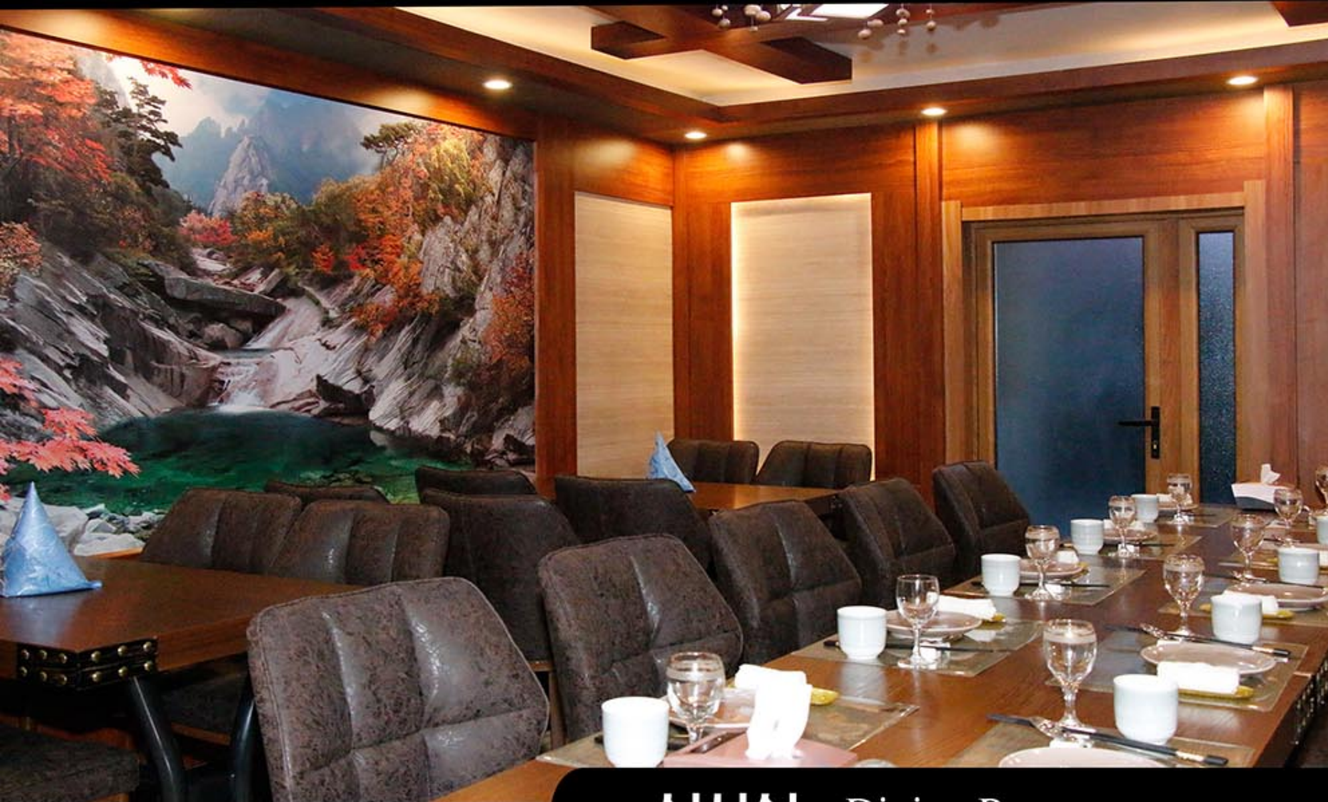
식사실 Dining Room

Thongchon Holiday Camp for Diplomatic Corps