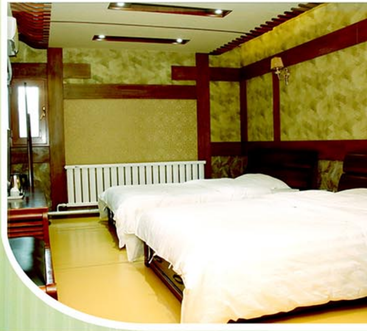
아담하고 포근한 호실들

The camp gives priority to offering convenience to the guests.