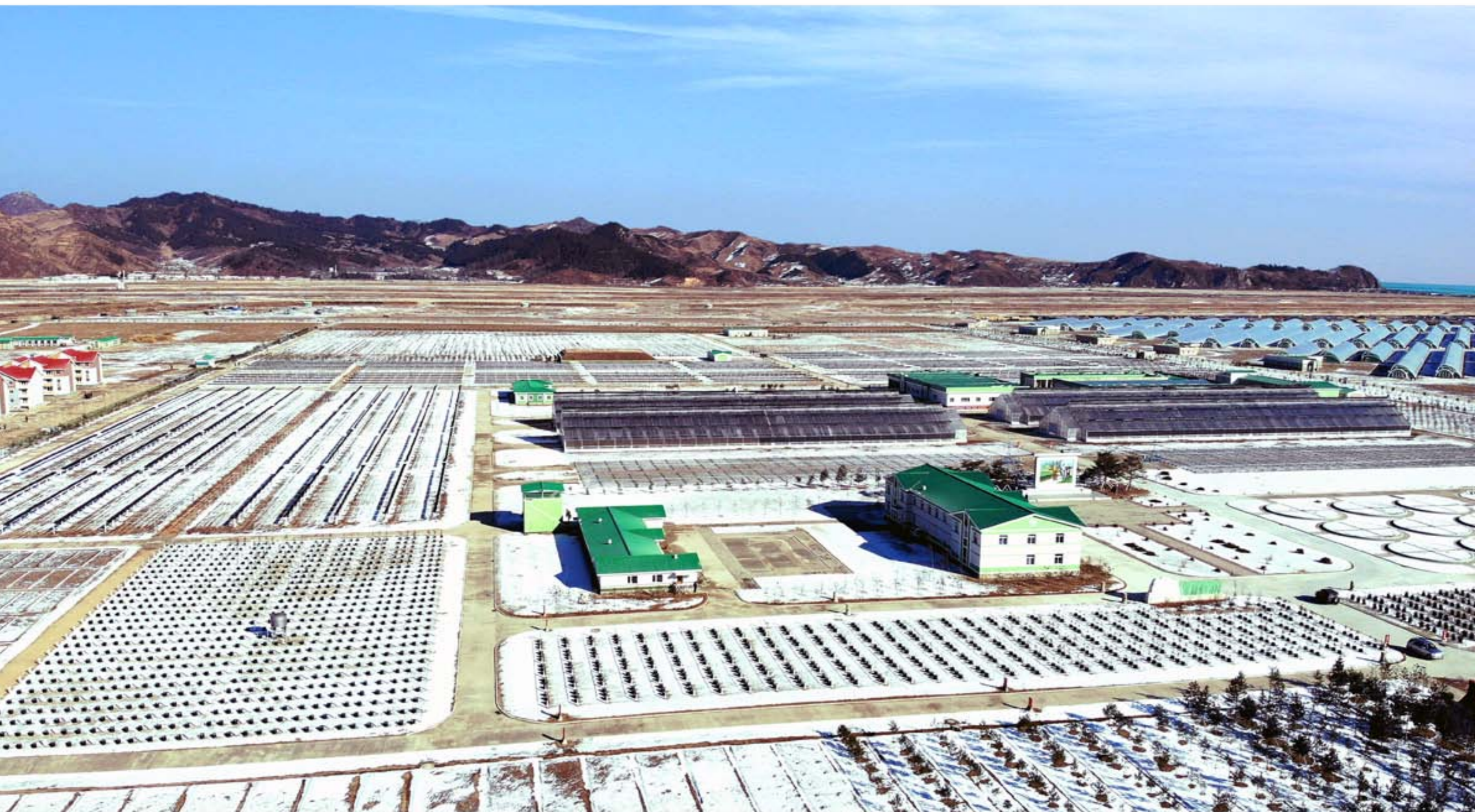
The tree nursery turns out 20 million saplings of pine, pine-nut, fir and other tree species every year.